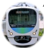
TABELA DE HORARIO LINHA SEIBU MUDA EM 14 DE MARÇO

A tabela de horário de cada estação das linhas Seibu Ikebukuro e Seibu Shinjuku mudarão a partir de 14 de Março (Sab.). Todos os trens expressos limitado entre Ikebukuro e Chichibu vão utilizar o trem nomeado "Laview". Haverá várias pequenas alterações, na tabela de horário. haverá um trem semi-expresso a mais na noite dos dias de semana por volta das 11:00 p.m. A conexão na estação Kotesashi dos trens locais de Hanno para trens F-Liner, que saem de Kotesashi para Yokohama, melhorará. Informações: Centro do Consumidor Ferroviária Seibu ☎04-2996-2888