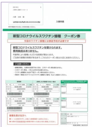
Seu cupom é parecido com esse!