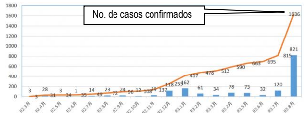
casos confirmados mensalmente em Iruma de Março 2020 á Agosto 2021

A cidade de Iruma está preparando seu próprio sistema de suporte para pacientes com COVID-19 que ficam em casa. Verifique se há atualizações