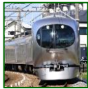
TABELA DE HORARIO LINHA SEIBU MUDA EM 16 DE MARÇO

A tabela de horário de cada estação das linhas Seibu Ikebukuro e Seibu Shinjuku mudarão a partir de 16 de março (sab.). Um trem expresso que sai as 8:45 de Hanno para Ikebukuro será adicionado na manhã dos dias de semana.