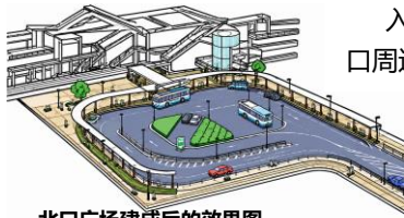
北口广场建成后的效果图